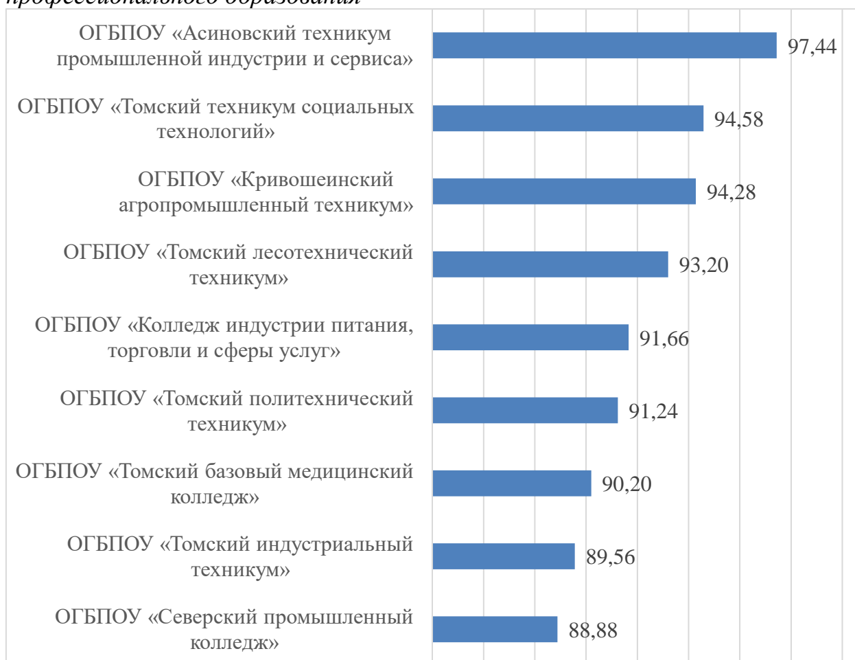
Гистограмма 1.1 Итоговый рейтинг по результатам сбора, обобщения и анализа информации о качестве условий оказания услуг организациями, осуществляющими образовательную деятельность на территории Томской области, среди организаций среднего профессионального образования