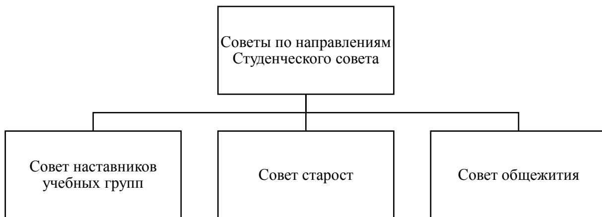
Рисунок 3 – Советы по направлениям Студенческого совета ОГБПОУ «ТомИнТех»